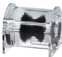
magneet niet inbegrepen