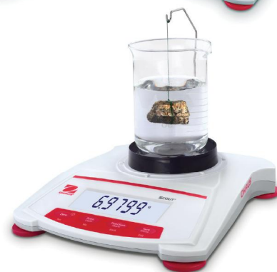
Scout illustrée avec le kit de détermination de densité en option